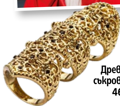
Древни съкровища 46

Посетете страницата ни във facebook списание „Story“